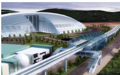
“澳門東亞運動會體育館” 車站

C260地段由氹仔排角延伸到路氹城東的面積，包括16號站至23號站的高架道路和當中的4個車站：