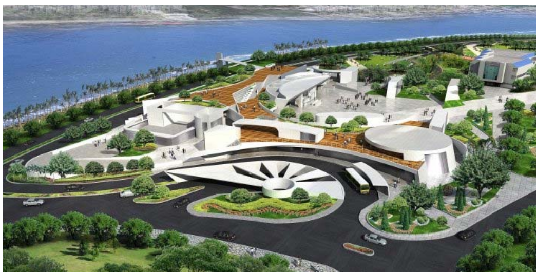
Estação da Barra

Para este novo projecto estão incluídos todos os trabalhos de instalação, testes e comissionamento para Extensão da Linha incluindo a sua integração com o sistema existente, nomeadamente: